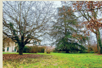
Création d'un parc public et d'une crèche au Domaine-Patry 6