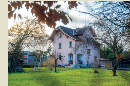
Acquisition de 2 parcelles au chemin des Voirons pour de futurs équipements publics