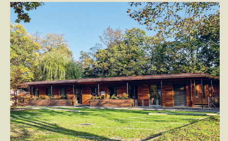
Construction d'une crèche provisoire sur le parking vert de la salle communale