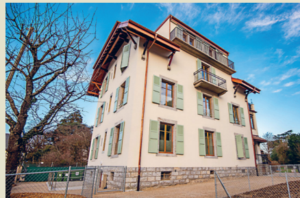
Rénovation au Villaret 10 (nouvelle maison de Tara)

+ laisser de beaux souvenirs à nos enfants dans une commune vivante et verdoyante où ils auront pu grandir et s'épanouir, tant dans l'espace public qu'à l'école. Ils auront alors à cœur de rester à leur tour à Chêne-Bougeries afin d'y fonder leur famille